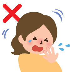
せきやくしゃみを 手で押さえる