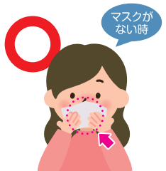
ティッシュ・ハンカチで 口・鼻を覆う