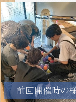
前回開催時の様子